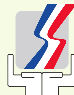
Ministerio De trabajo